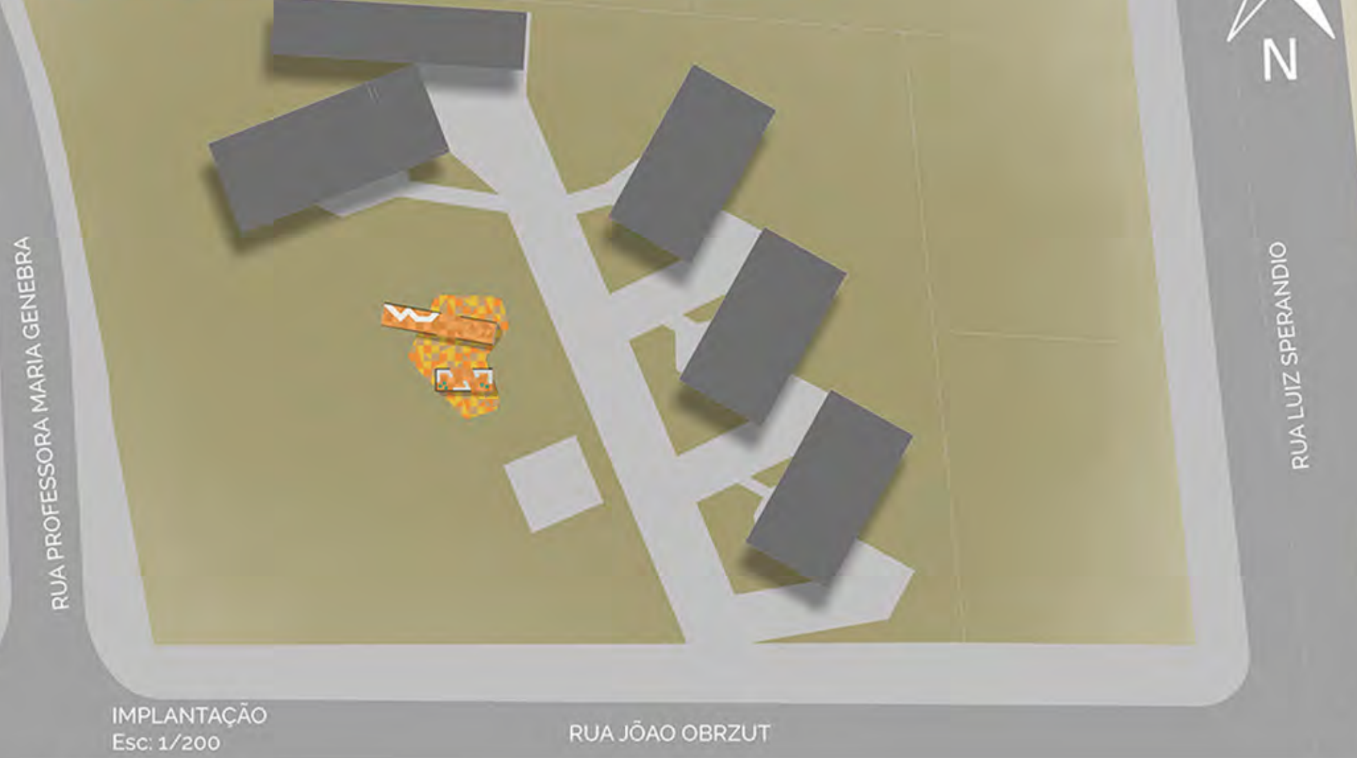
IMPLANTAÇÃO Esc: 1/200