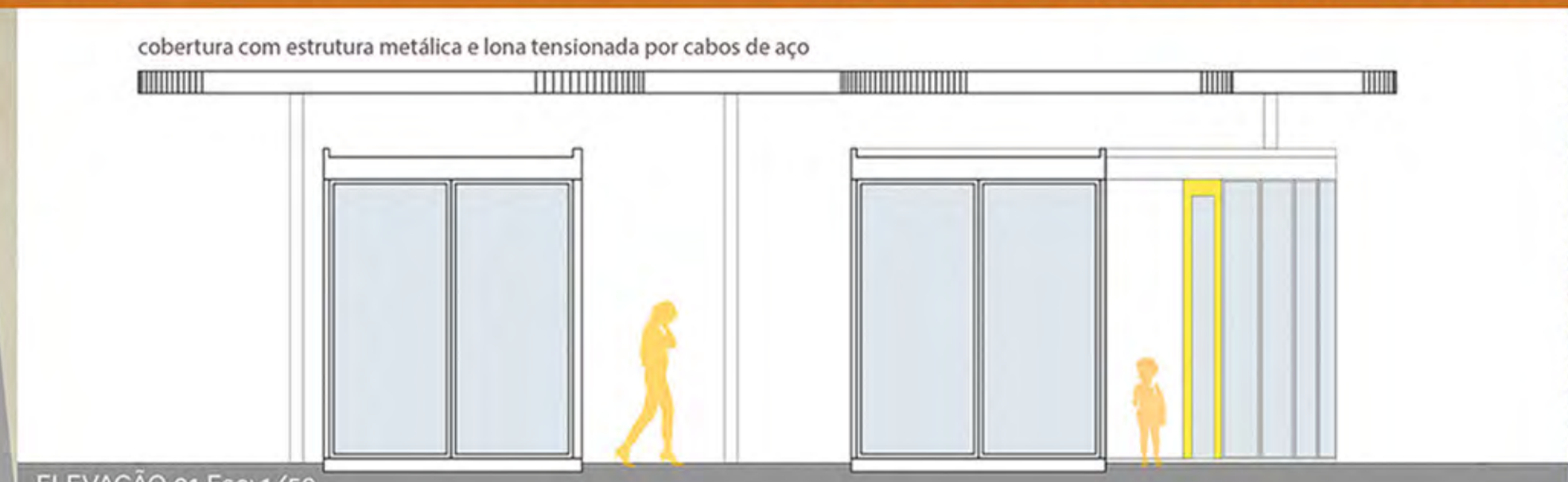
ELEVAÇÃO 01 Esc: 1/50