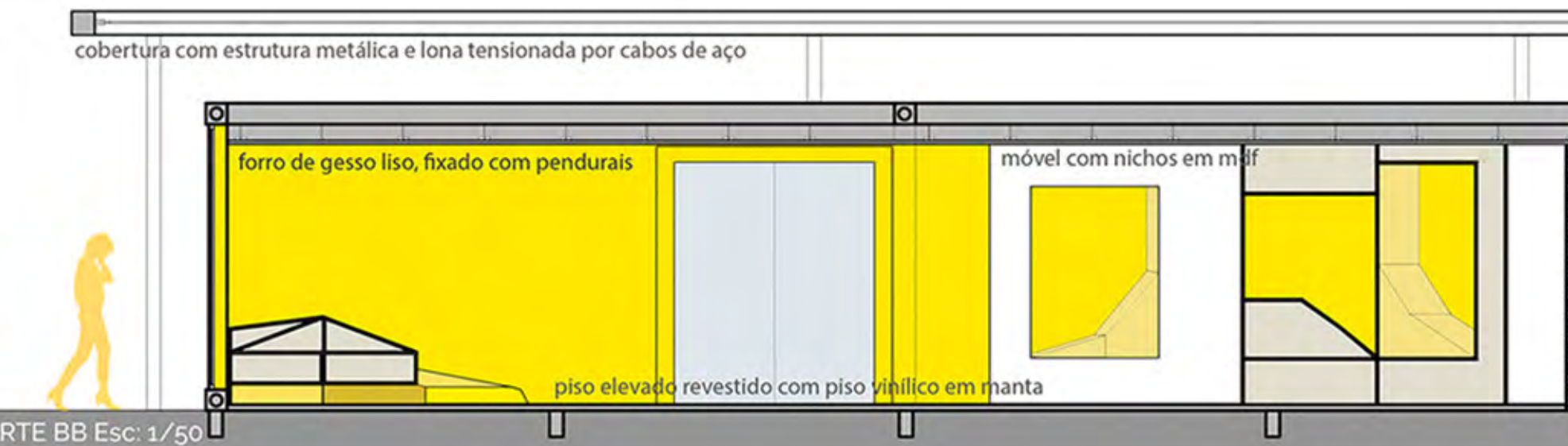
CORTE BB Esc: 1/50