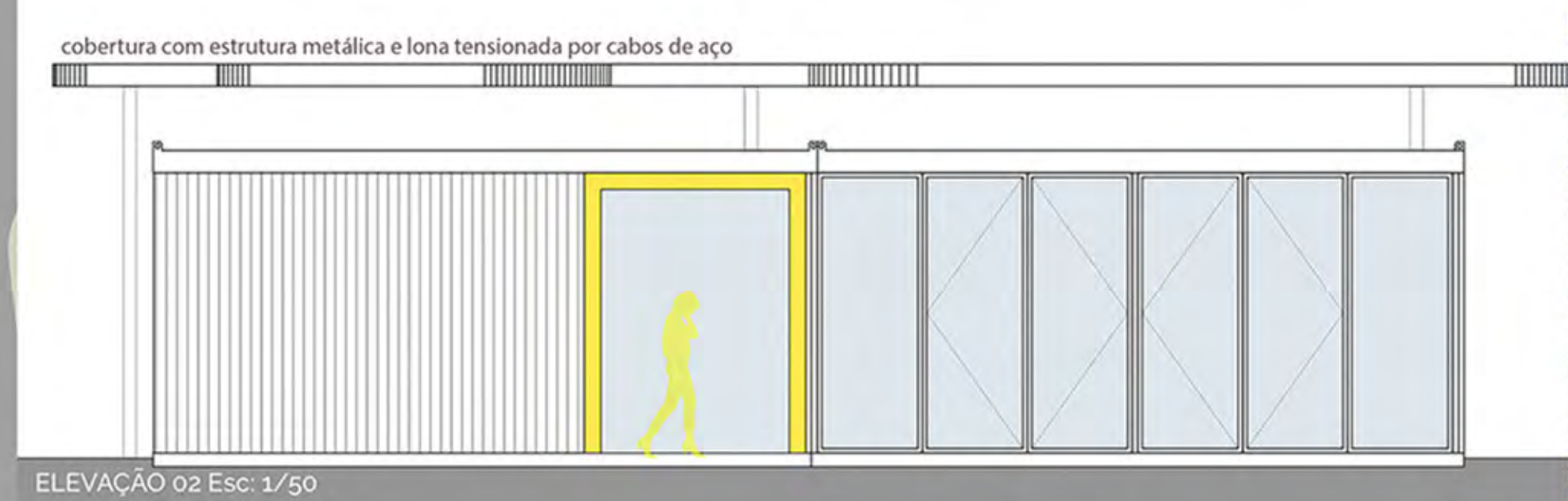
ELEVAÇÃO 02 Esc: 1/50